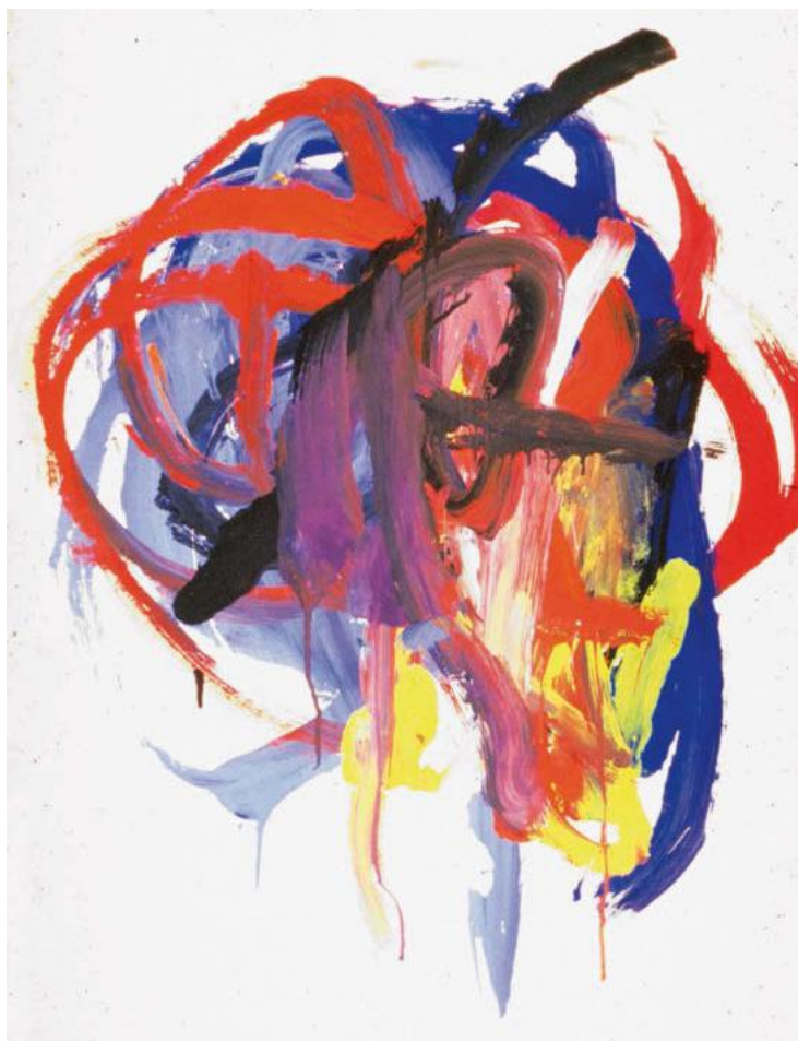
Die ersten Körperbilder werden rein motorisch kreisend gesteuert. Es entstehen Kritzelknäuel.