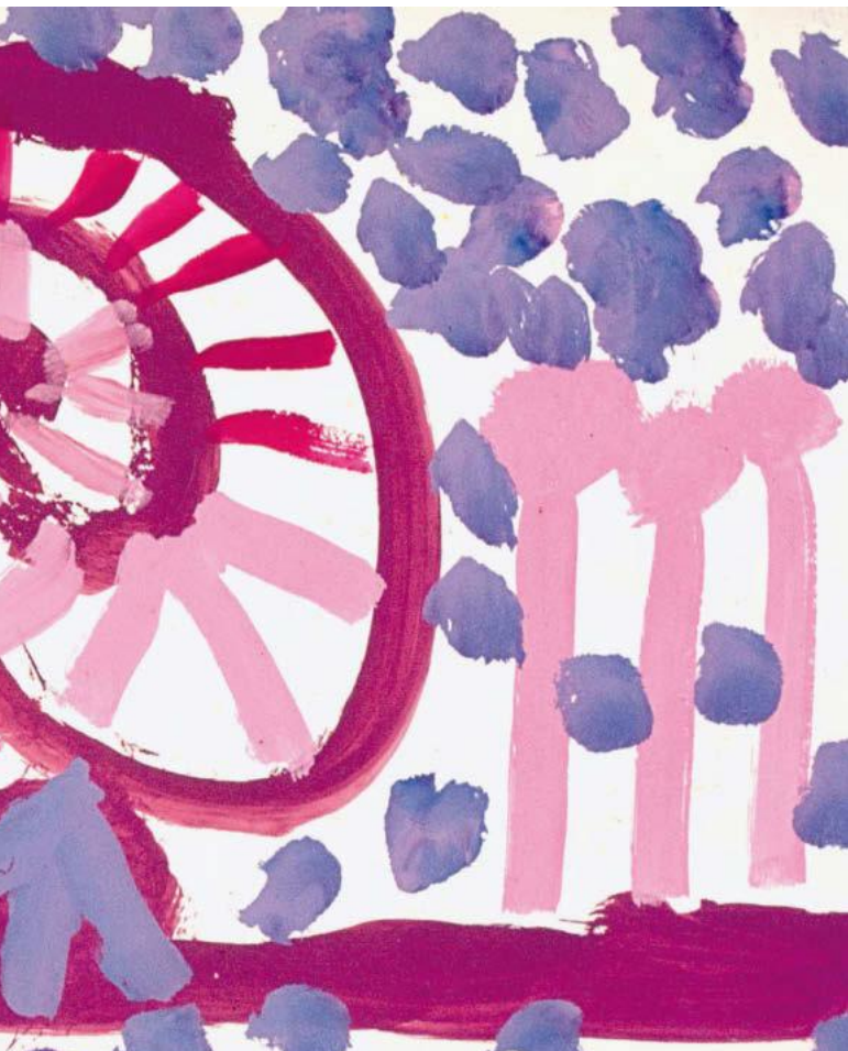
wird entdeckt, Absicht wird möglich.