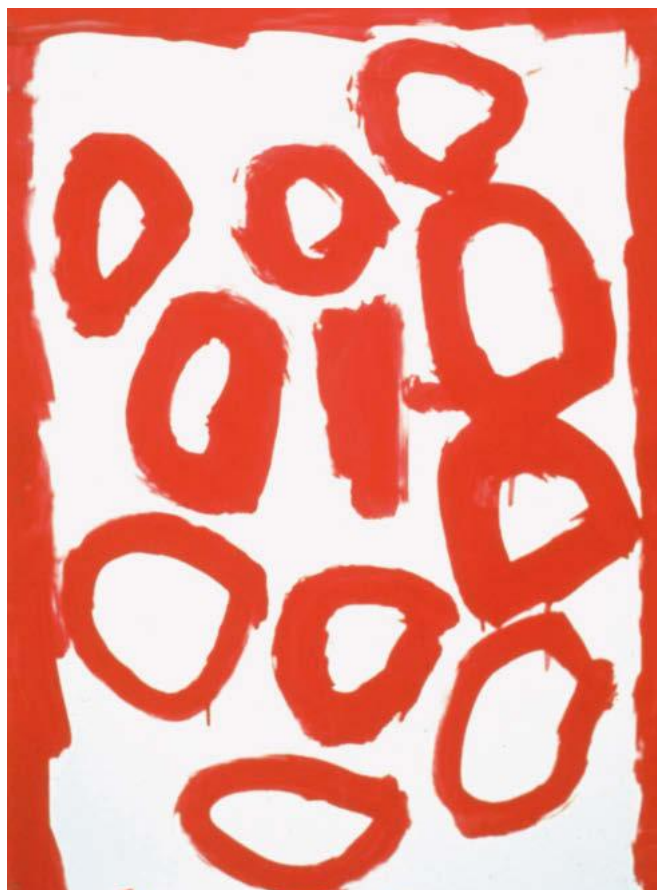
Irgendwann trifft die Richtung auf ihren Anfang, die Form wird geschlossen.