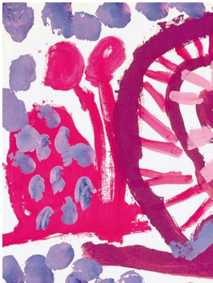
Aus dem Kritzelknäuel entwickelt sich die Spirale: Eine Richtung

ben grosse Bilder gemalt. Manchmal standen sie sogar auf in ihren Rollstühlen, um den oberen Rand des Bildes zu erreichen. Andere lagen bäuchlings auf Liegebrettern, hatten eine Farbpalette neben sich und zeigten mir, welche Farbe sie möchten, und ich gab ihnen den Pinsel mit der gewünschten Farbe – so malten sie wie die Könige.